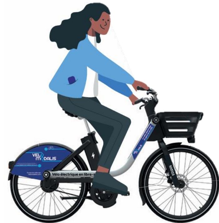
Vélos en Libre Service