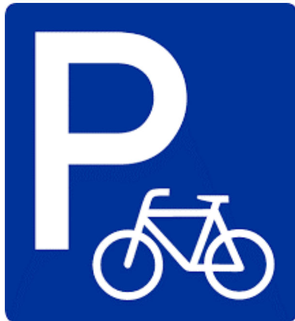
Abris Vélos Sécurisés